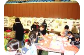
スイーツデコボックス作り