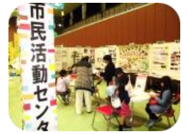
お馴染みのシンボルタワー