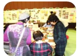
和紙ちぎり絵色紙作り